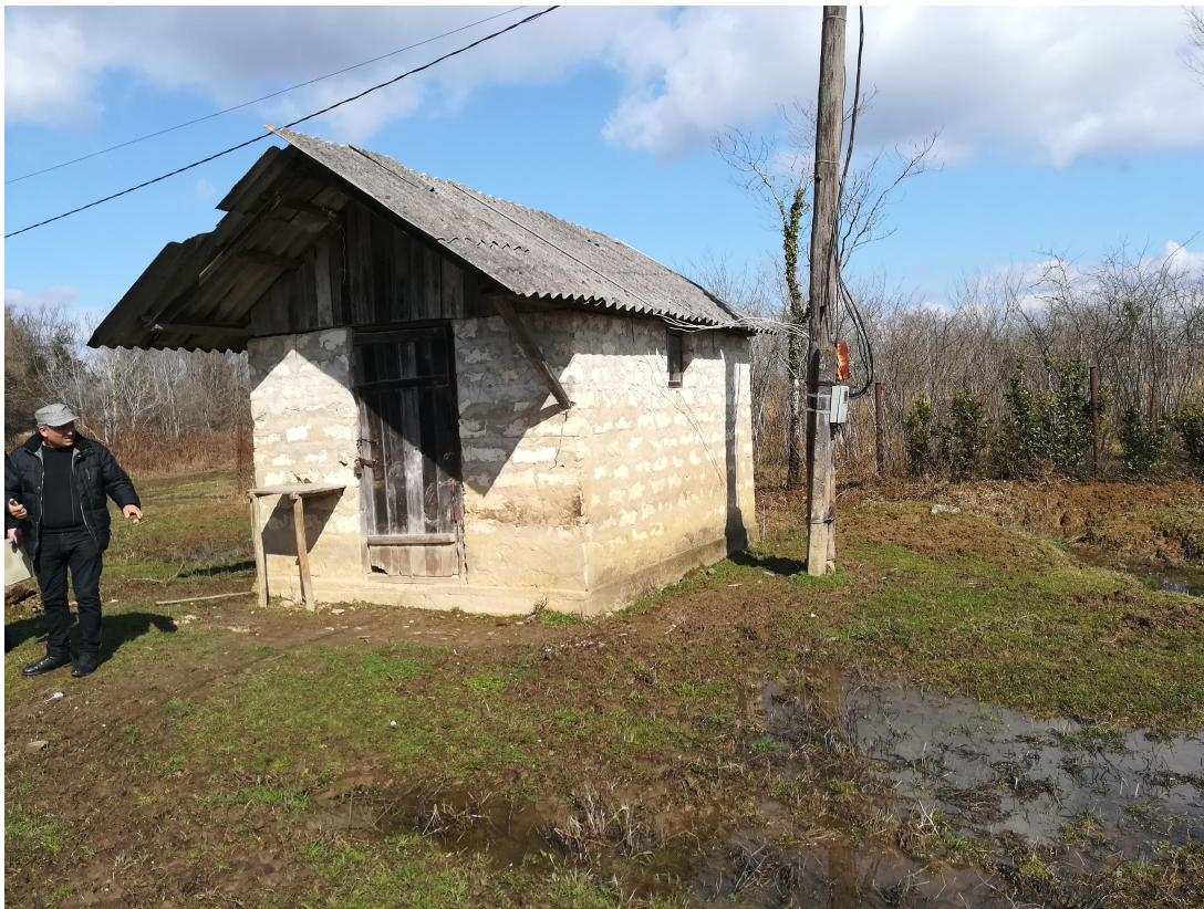
არსებული სიტყარის ამსახველი ფოტო-მასალა